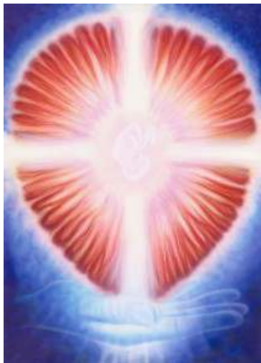
No Woman No Cry